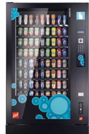
Robimat XL, Standardausführung mit 8 Ebenen