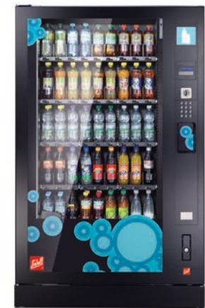
Robimat XL, Standardausführung mit 5 Ebenen